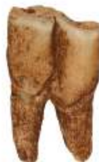
Ένα (1) αντίγραφο δοντιού δασόβιου ρινόκερου, περίπου 100.000 χρόνια πριν, Ασπροχάλικο Πρέβεζας, Αρχαιολογικό Μουσείο Ιωαννίνων, αρ. ευρ. 7574-1