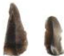
Δύο (2) πειραματικά λίθινα αποκρούσματα (τα αντικείμενα μπορεί να διαφέρουν λίγο από αυτά της φωτογραφίας)