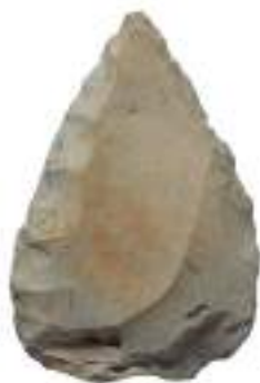
Ένα (1) αντίγραφο λίθινης αιχμής δόρατος, ίσως 50.000 χρόνια πριν, Κοκκινόπηλος Πρέβεζας, Αρχαιολογικό Μουσείο Ιωαννίνων, αρ. ευρ. 10011