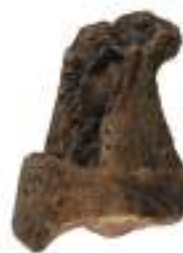
Ένα (1) αντίγραφο σκόπιμα ανοιγμένης φάλαγγας από κόκκινο ελάφι, 24.000-13.000 χρόνια πριν, Σπήλαιο Καστρίτσας Ιωαννίνων, Αρχαιολογικό Μουσείο Ιωαννίνων, αρ. ευρ. 11403