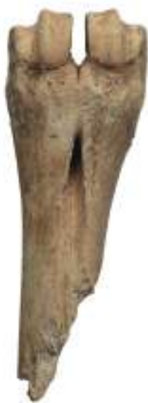
Ένα (1) αντίγραφο σκόπιμα σπασμένου μακρού οστού από πόδι κόκκινου ελαφιού, 24.000-13.000 χρόνια πριν, Σπήλαιο Καστρίτσας Ιωαννίνων, Αρχαιολογικό Μουσείο Ιωαννίνων, αρ. ευρ. 11407