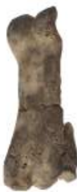
Ένα (1) αντίγραφο σκόπιμα ανοιγμένης φάλαγγας από αλπικό αίγαγρο, 16.000-13.000 χρόνια πριν, Βραχοσκεπή Κλειδί Ιωαννίνων, Αρχαιολογικό Μουσείο Ιωαννίνων, αρ. ευρ. 11421